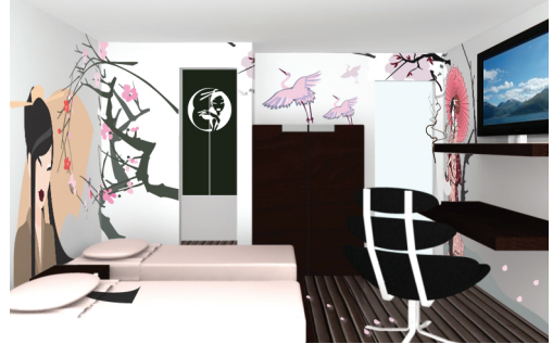
FIG. 3: LA JAPANESE ROOM, UNA SUITE MINIMALE ISPIRATA AL DESIGN GIAPPONESE.

VERLAG, UNO DEI PIÙ IMPORTANTI EDITORI NEL SETTORE DELLE ARTI VISUALI, VIENE LANCIATO UN BANDO INTERNAZIONALE, CUI PARTECIPANO PIÙ DI 3.000 CONCORRENTI. NEL BANDO VIENE FORNITA LA PLANIMETRIA DI UNA STANZA TIPO DELL'ALBERGO E I CONCORRENTI SONO LIBERI DI DECORARE LE PARETI, SELEZIONARE MOBILI E COMPLEMENTI D'ARREDO, INSERIRE STATUE, DIPINTI, MONITOR. IL MIO STUDIO PARTECIPA AL CONCORSO, PRESENTANDO DUE STANZE.