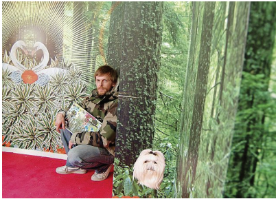
FIG. 8. ARTISTI IN POSA ALL'INTERNO DELLA PROPRIA STANZA.

FIG. 7. ARTISTA IN POSA ALL'INTERNO DELLA PROPRIA STANZA.