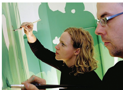
FIG. 6: ULTIMI RITOCCHI PRIMA DELL'APERTURA DELL'HOTEL.