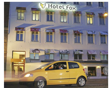
FIG. 1: LA FACCIATA DELL'HOTEL FOX

IL CONCETTO DI ESPERIENZA DIVENTA COSÌ UNO DEI FATTORI CRUCIALI DELLE STRATEGIE DI MARKETING. IN THE EXPERIENCE ECONOMY , JOSEPH PINE II E JAMES GILMORE ELABORANO UNA NUOVA CHIAVE DI LETTURA PER IL VALORE DELLA MERCE. NELLA VISIONE ECONOMICA CLASSICA, IL VALORE DELLA MERCE EQUIVALE ALLA FORZA LAVORO; NELLA CULTURA DEI CONSUMI LA MERCE È LEGATA AI PATTERN COMUNICATIVI CHE RIESCE AD INTRECCIARE CON IL SOGGETTO. NELLA CULTURA DELLE ESPERIENZE, IL VALORE DELLA MERCE È LEGATO AL CONCETTO DI TEMPO: "VALUE IS THE TIME CUSTOMERS SPEND WITH YOU". IL VALORE DI UNA MERCE È