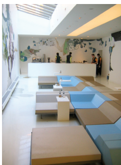
FIG. 4: LA HALL DELL'ALBERGO.

3. SECONDO LOGICHE DI VIRAL E GUERRILLA MARKETING, MOLTI FORUM SU INTERNET VENGONO TEMPESTATI DI MESSAGGI ANTICIPATORI PER L'EVENTO E CENTINAIA DI BICICLETTE DANESI VENGONO RICOPERTE DA NASTRO ADESIVO CON STAMPATO IL LOGO DEL PROGETTO.